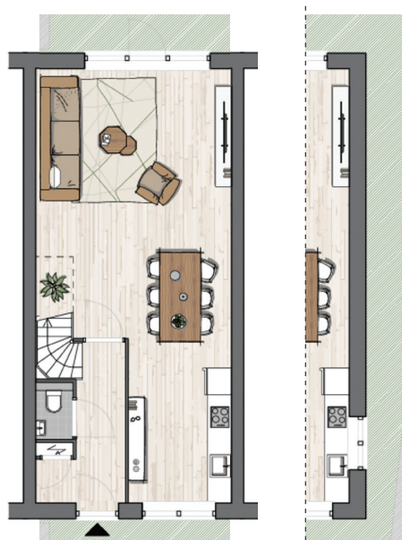
Begane grond Rijwoning 11 (of hoekwoning 14)