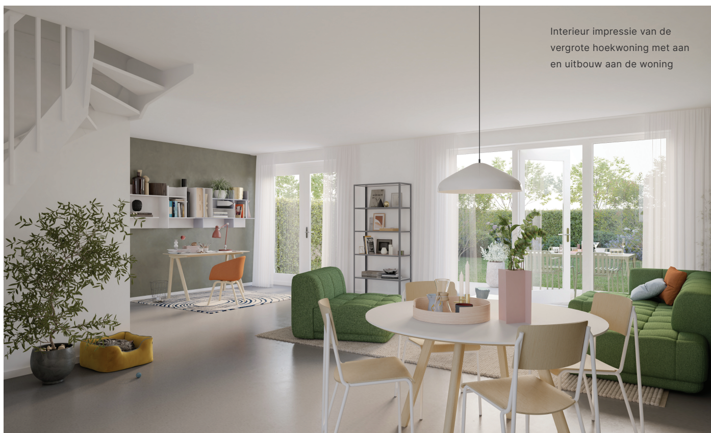
Interieur impressie van de vergrote hoekwoning met aan- en uitbouw aan de woning